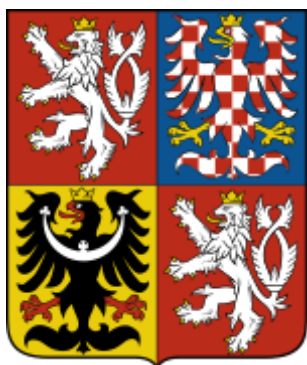
Státní velký znak