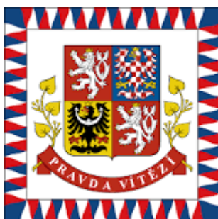
Vlajka prezidenta republiky