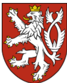
Státní malý znak